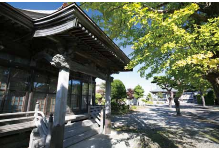
ようやく北国も緑の映える季節となりました。