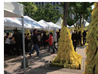
↑ソウル市庁舎前の広場は黄色一色。犠牲者を思い、黄色のリボンに思い思いの言葉を書いて束ねてありました。

お釈迦様はお生まれになってすぐに「天にも地にも我一人」とおっしゃいました。この地球上の生きとし生けるものの中で、たった一つしかない自分の命と同じように、他の人やものにもそれぞれ尊い命があるとのお示しです。この度の犠牲者の方一人一人の変えがたい命の尊さを思い帰国の途に着きました。