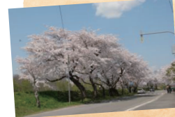
◇大野の桜並木! きれいですね!

さて、皆さん今年の桜、見ましたか? 私は北斗市花回廊バッチリ満喫出来ました!! 丁度見頃だったGW中に、大野の桜並木、しだれ桜、鈴木牧場の桜アイス(笑)、上磯陣屋桜の黄金コースをドライブしてきましたよ! そして、今年初めて陣屋桜まつりにも行ってみました。たくさん出店が出ていて、ステージも華やかでとっても楽しかったです! 北斗市公認アイドルも初めてお目にかかりました 笑 そんな桜三昧の今年でしたが、個人的に1番好きだったのは、“戸切地川”です。川沿いに桜のトンネルみたいになっていて凄く綺麗!!! ぼぉと眺めているとたまに電車がガタゴトンと通り過ぎてゆく景色ものどかでほっとします。