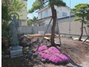
↑建設途中のペット供養塔。塀際にはカイヅカイブキを植える予定です。

◆お盆前をめどに、裏の栗の木前に永代供養塔を、表の境内にペット供養塔を建設中です。永代供養塔横に、境内の庭にあった八重桜と梅の木を移植しました。永代供養塔・ペット供養塔の詳細はまた改めてお知らせ致します。