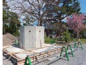
↑建設途中の永代供養塔。どんな形になるんでしょうか??