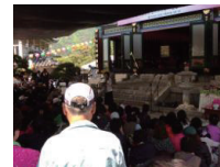
↑花祭りの初めに行われた、犠牲者追悼の詩の朗読。