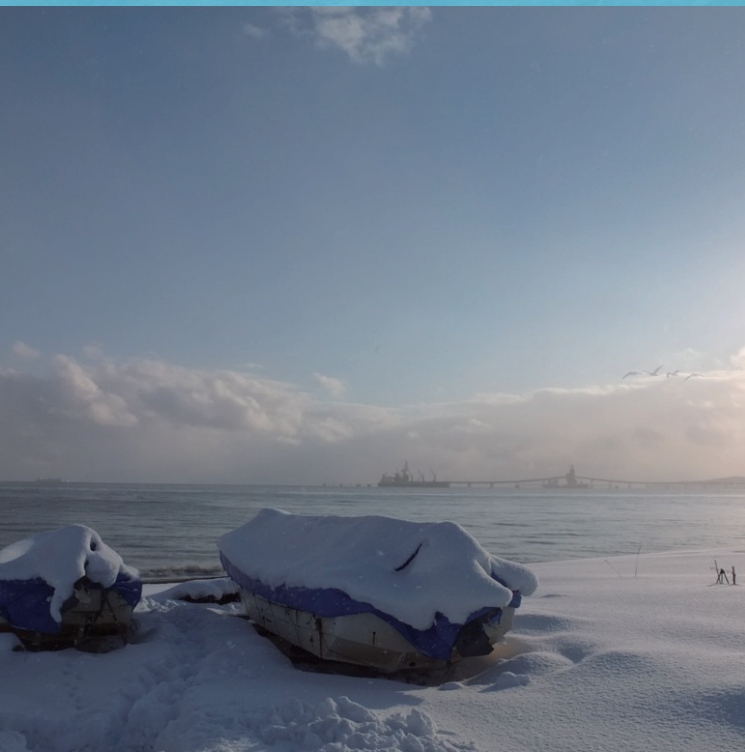
吉田一穂「白鳥」より

掌に消える北斗の印。 然れども開かねばならない、この内 部の花は。 背後で漏沙が零れる。