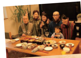
◇ 本年もよろしく お願いいたします！