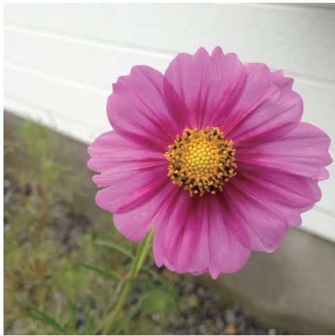
◆ 庭に咲いたコスモスの花。

この世の中には「しなげな ありまじきこと」などひとつも 自由になんか考えずにはな さなければ、何かを手にいれ なれば実現されぬ幸福な ものは幻のようなものです。