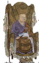
瑩山禅師 【けいざんぜんじ】

◆1321年、瑩山禅師様によって開創された總持寺。1898年の火災によって焼失したことから、1911年に石川県輪島市から現在の横浜市鶴見区に移転された。