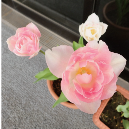
◆ あいらしいチューリップの瞳

輝てたせいまく光とえ月の き、のんもすど映ばの だ仏は。の。ん仏し、輝く すのた水と月なの出そ、夜 の慈いらをいは人慈いさの 悲ひきすう遠にも悲はてに澄 ががあうけに降、い月がだ あなつとであり分ますキ水 たていはっ注けす。ラをす のはうあり美でて月のラ 中じありましいな